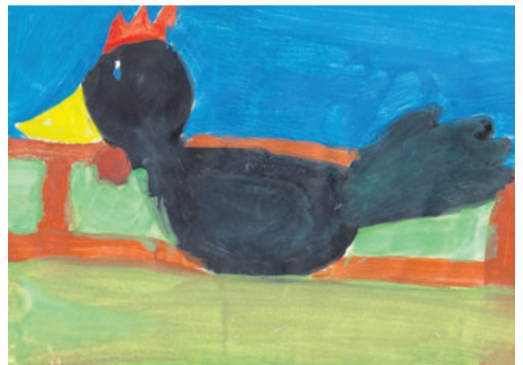
Dieses Bild heißt „Glucke“. Gemalt hat es

Nach einer Woche durchleuchtet (schießt) Johann Meyer die Eier, und wir können sehen, welche befruchtet sind. Wenn die Küken nach 21 Tagen schlüpfen wollen, ist es spannend, dieses anstrengende Ereignis zu beobachten: Manchmal rollt ein Ei, dann arbeitet das Küken von in-