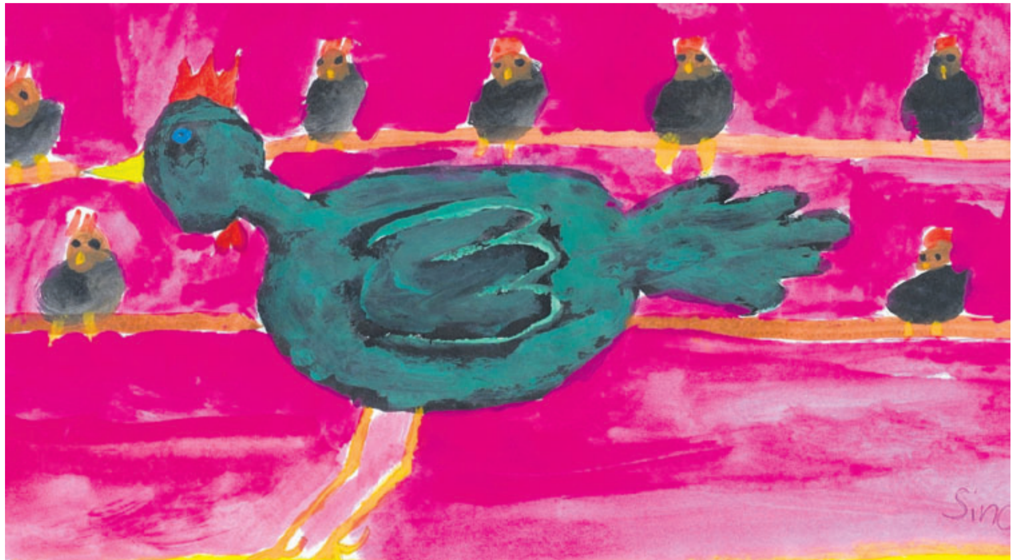
Die Hühner auf der Stange: Dieses Huhn im Vordergrund (mit dem Nachwuchs im Hintergrund) gehört wohl der Zwerghuhnrasse „Australorps schwarz“ an.

Verden. Sie pendelt zwischen Büro und Ausgrabungsstätten hin und her. Entdeckt sie alte Funde, schreibt sie Aufsätze darüber oder hält Vorträge. Jutta Precht ist Kreisarchäologin. Ihr ältester Fund ist 7000 Jahre alt. Die Klasse 3b der Nicolaischule in Verden hat die Archäologin besucht und sich das Archiv angeschaut. Seite 3